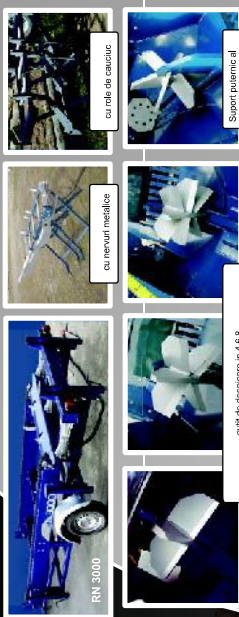
cu rufe de cauciuc

MASA RĂDĂCĂTOARE DM 1511 PENTRU RCA360 SI RCA 400 joy masă rădăcătoare pentru DM 1511 • poate fi transportată cu autoturajul PCA